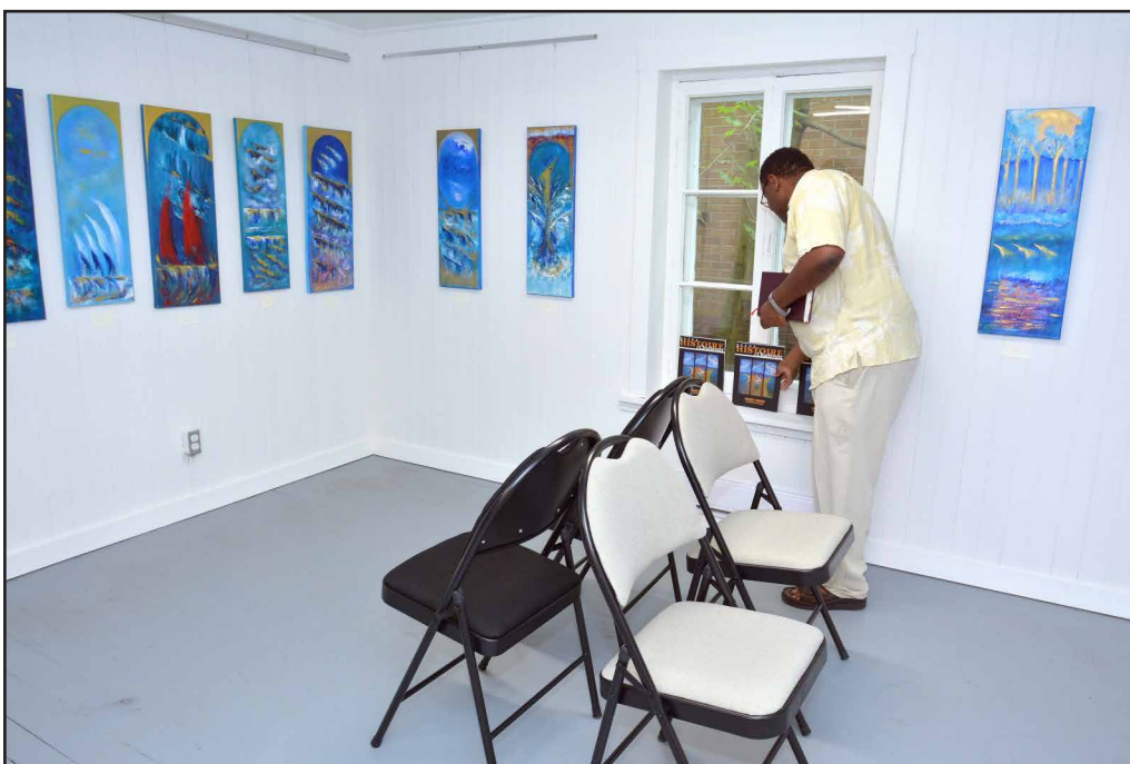
Le deuxième étage de la forge Riverin

À noter qu'à partir du 5 septembre l'Espace Mémoire Riverin sera accessible du lundi au vendredi de 9h00 à 16h00 et le samedi de 9h00 à 16h00. Entrée libre-Contribution volontaire. Les livres et Revues de notre Société d'histoire sont en vente sur place. Cet horaire est en vigueur jusqu'au 31 octobre. Signalons qu'entre le 1 er novembre 2017 et le 1 er mai 2018 l'Espace Mémoire Riverin sera ouvert sur demande seulement. De retour à l'été 2018!