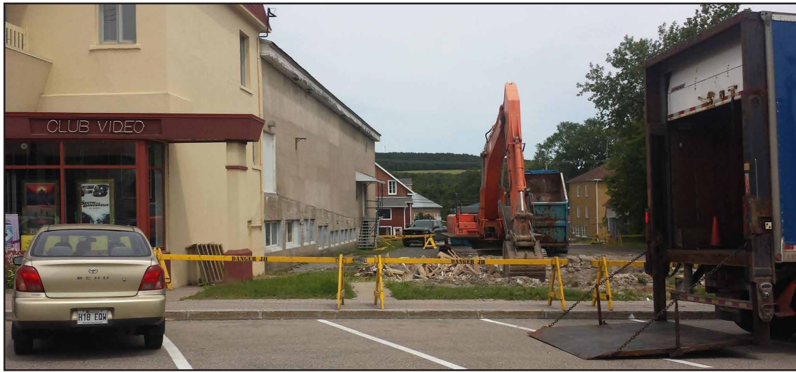
Démolition de la maison du cordonnier à La Malbaie