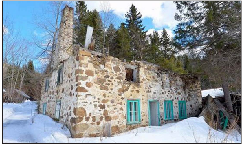
Moulin César de Baie-Saint-Paul dans un piteux état

Je faisais le constat cette année que, pour la région de Charlevoix, sur une dizaine de bâtiments classés à titre de monuments historiques par nos gouvernements, trois étaient dans un état jugé inquiétant : le moulin César de Baie-Saint-Paul, la Maison Leclerc à l'île aux Coudres, la maison René-Richard aussi à Baie-Saint-Paul. Notons que deux de ces bâtiments sont situés à Baie-Saint-Paul, une municipalité que les supposés spécialistes en patrimoine considèrent comme soucieuse de son passé.