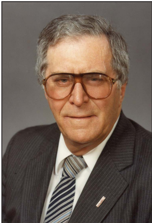
Martial Asselin (1924-2013)

C'est là... dans la montagne... qu'ils se forgeaient des âmes guerrières. Menaud maître-draveur. Édition de 1937